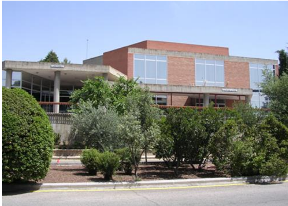
IES Universidad Laboral (Toledo)